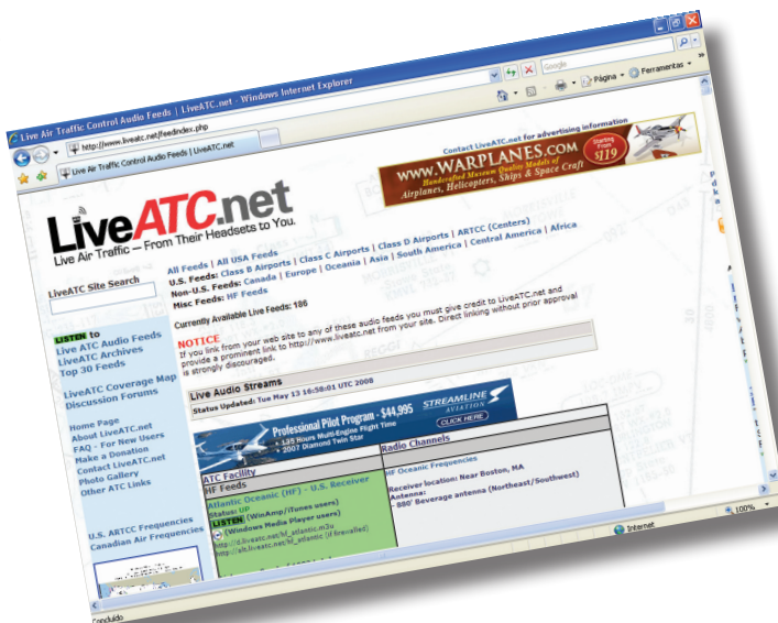
O liveatc disponibiliza escuta aérea em diversas partes do mundo.

Vale ressaltar que a escuta de frequências aeronáuticas não é considerada ilegal no Brasil, desde que não interfira na comunicação, conforme determina o artigo 57 da Lei nº 4.117/62. ■